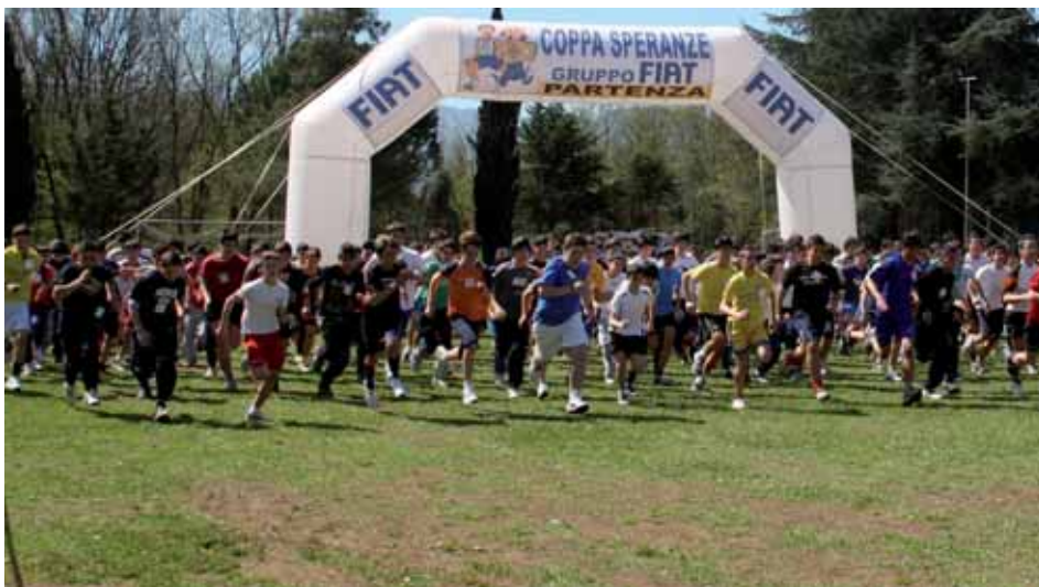
La partenza di una batteria maschile della tappa di Cassino della Coppa Speranze Gruppo Fiat. La manifestazione di Cassino è stata la più numerosa in assoluto, con 1204 studenti partecipanti in rappresentanza di 27 Scuole.

avrà le medesime caratteristiche tecniche delle fasi comprensoriali. Si tratta cioè di una prova di corsa campestre sulla distanza dei mille metri (identica per tutti, uomini e donne) ed ogni istituto potrà parteciparvi con quattro alunni per ciascuna delle categorie in gara, tre dei quali determineranno la graduatoria, attraverso i loro piazzamenti ed i relativi punteggi. Dalla somma appunto di questi diciotto punteggi (nove maschili ed altrettanti femminili) si arriverà alla classifica finale, sancendo la scuola che si porterà a casa il Trofeo. Per quanto riguarda poi nello specifico le fasi comprensoriali di quest'anno, quella che ha fatto registrare il più elevato numero di partecipanti e, conseguentemente, di scuole rappresentate, è stata sicuramente la Coppa Speranze Fiat di Cassino, con 1204 alunni iscritti, 27 istituti e 41 Comuni. Alle sue spalle, nell'ordine, le edizioni di Lanciano (954 alunni, 21 istituti e 39 Comuni), Melfi (630 alunni, 15 istituti e 16 Comuni), Modena (588 alunni, 13 istituti e 9 Comuni) e Sulmona (395 alunni, 14 istituti e 17 Comuni). Il tutto, per un tota-